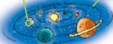
Земља и друге планете Сунчевог система