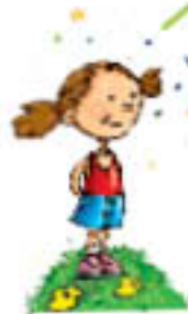
ви на Земљи