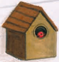
кућица за птице