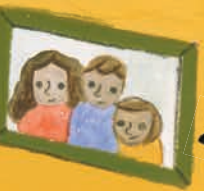
рам за слику

Лорен обува ципеле и тражи ранац. Где ли је?